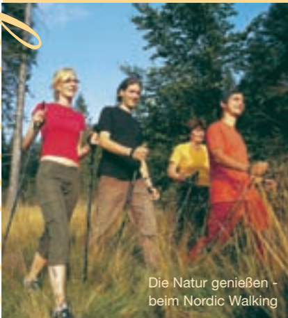
Die Natur genießen - beim Nordic Walking

Eine malerische Landschaft, die das Hochland des Waldviertels mit der lieblichen Wachau verbindet. Sanfte Hügel, bewaldete Berge, sprudelnde Bäche und ein Blick bis weit in die Alpen. Hier lässt sich im Einklang mit der Natur unerschöpfliche Kraft tanken und Erholung finden.