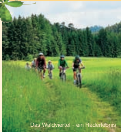
Das Waldviertel - ein Raderlebnis

Entdecken Sie historisch interessante Kultstätten. Märchenhaft seltsame Steininformationen wie Totenkopfstein und Herzstein, oder die Kraft des Wassers – an einem der ruhigen Seen – oder in der wildromantischen Ysperklamm.