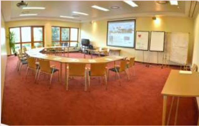
Seminarraum I „Glücksmuschel“ ca. 70 m

direkter Zugang ins Freie, verdunkelbar, in absolut ruhiger Südlage