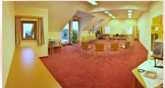
Seminarraum IV „Adler“ ca. 67 m 2