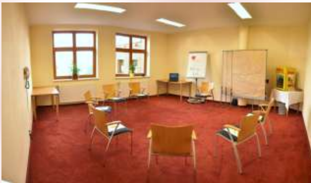
Seminarraum III „Glücksgroschen“ ca. 39 m 2