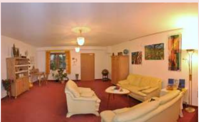
für Gruppenarbeiten: „Bibliothek“ ca 30 m 2