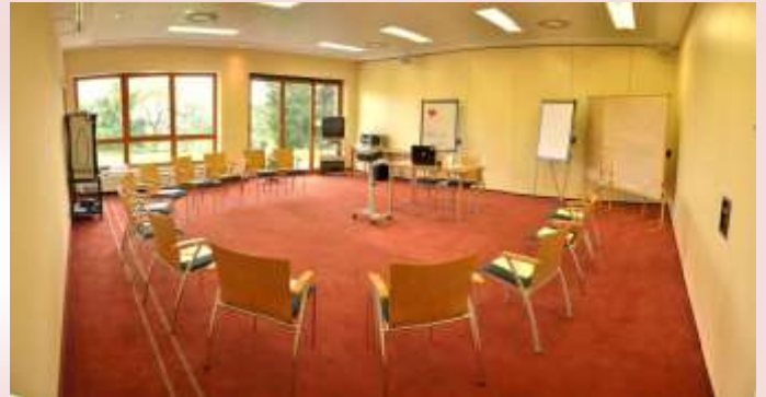
Seminarraum II „Azalee“ ca. 62 m 2