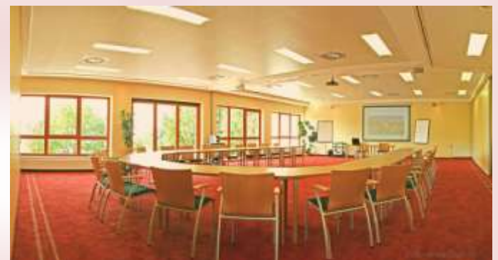
Seminarraum I+II ca. 140 m 2

weitere gemütliche Nischen für kreative Gruppenarbeiten